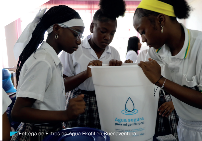
Entrega de Filtros de Agua Ekofil en Buenaventura

Con el objetivo de fortalecer el bienestar y la inclusión en el área de influencia , la Concesionaria Unión Vial Camino del Pacífico adelantó en Buenaventura una jornada integral de entregas y socializaciones en el marco de su estrategia +Formación, +Territorio.