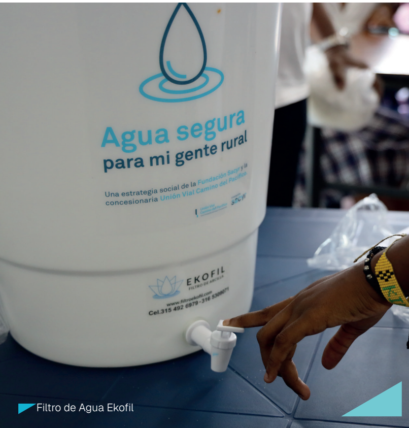
Filtro de Agua Ekofil